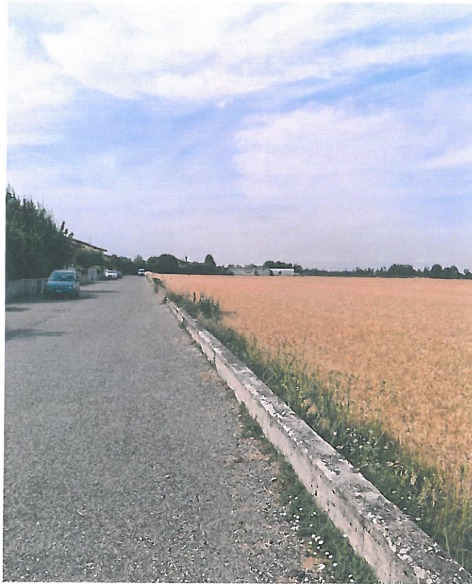
FOTO N.5: VISTA DI VIA CHIERCHI (VIA PRIVATA) VERSO VIA C. FULGOSI