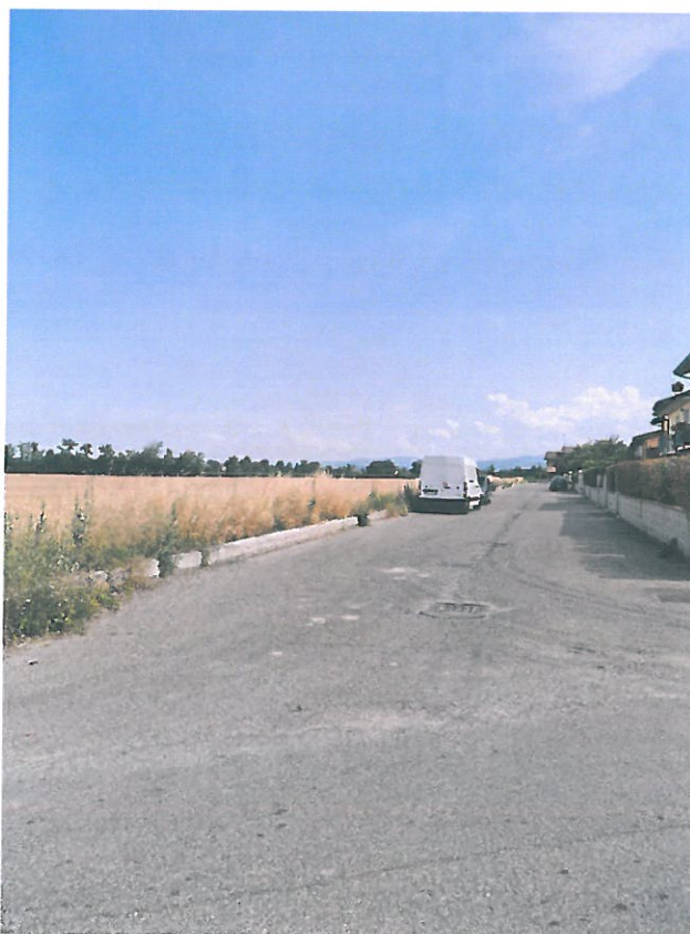
FOTO N.2: VISTA DA VIA C. FULGOSI VERSO VIA CHIERCHI (STRADA PRIVATA)