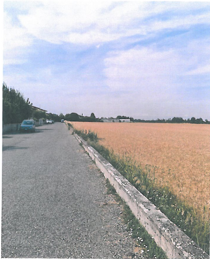
FOTO N.5: VISTA DI VIA CHIERCHI (VIA PRIVATA) VERSO VIA C. FULGOSI