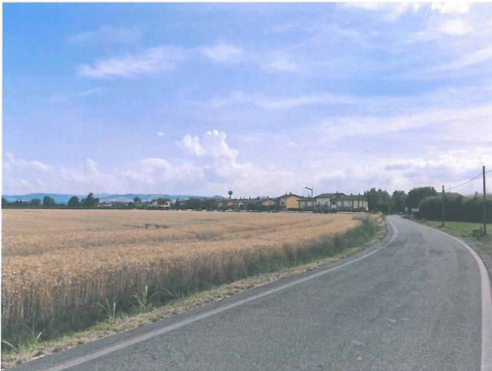
FOTO N.4: VISTA DA VIA C. FULGOSI VERSO CENTRO ABITATO GRAGNANO TR.